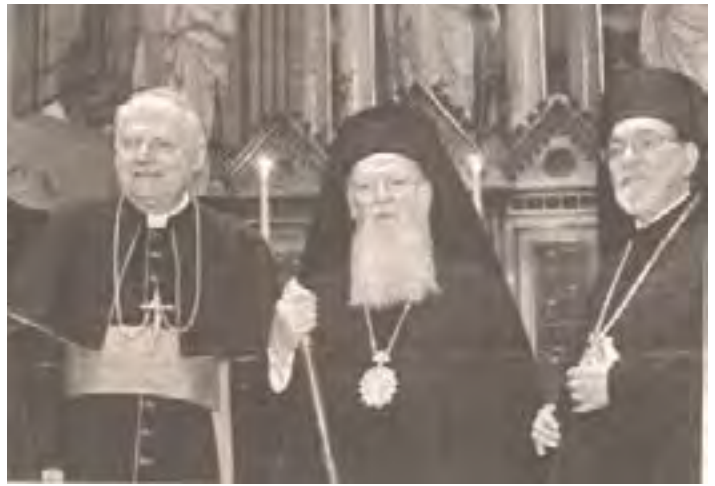
El Card. Scola con los ortodoxos.

Osservatore Romano, 30-08-2013: «Llamamiento de los religiosos nigerianos a cristianos y musulmanes. Ninguna religión promueve el mal... El islam es una religión de paz... el ministro nigeriano... ha subrayado la necesidad de una certificación religiosa entregada a los predicadores