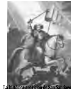
La histórica aparición de San Santiago Apóstol en la batalla de Clavijo, para ayudar a los cristianos en contra del Islam. ¿Que piensa el Cielo del ecumenismo?

«La civilización artificial» (Pío XII, 15.11.1946). Destrucción también del orden natural que es necesario a la Gracia. Ej. Revolución cultural homosexual, ... etc. «La gracia perfecciona la naturaleza, no la quita».