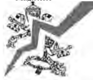
La Revolución antipapal.