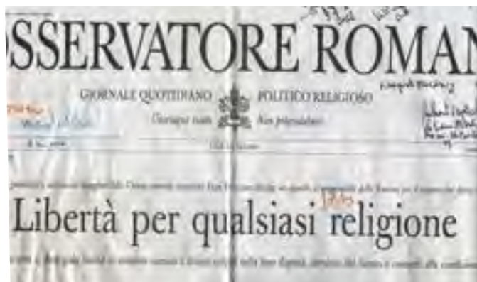
O.R., 22-11-2013 en la primera página.

San Pío X, Vehementer: «Que se deba separar el Estado de la Iglesia, es una tesis absolutamente falsa, y perniciosísima. Fundada en efecto en el principio de que el Estado no debe reconocer ningún culto religioso, esa tesis es antes que todo gravísimamente injuriosa para Dios; en efecto el Creador del hombre es también el Fundador de las sociedades humanas... Nosotros le debemos entonces, no solamente un culto privado sino un culto público y social para honrarle... No reprobamos y Nos condenamos la ley votada en Francia sobre la separación de la Iglesia y el Estado como profundamente injuriosa a Dios ».