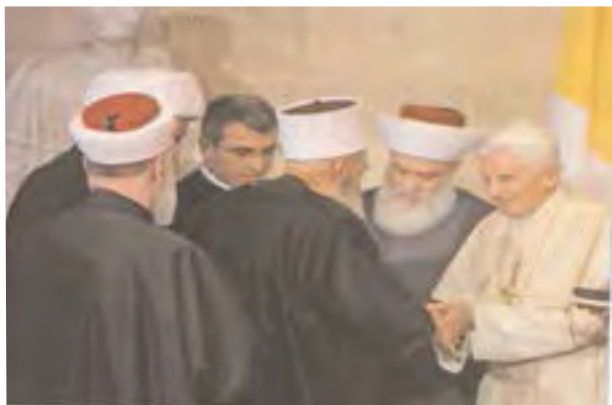
El Papa con los líderes religiosos musulmanes en Líbano