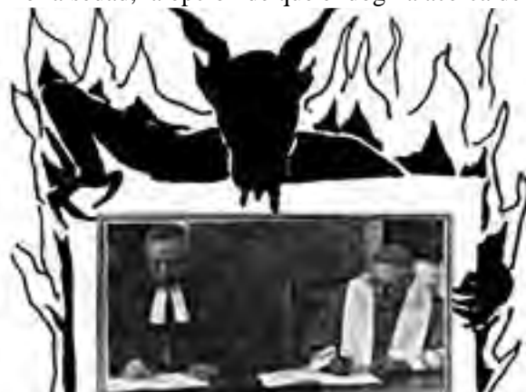
Con esta firma, 31-10-1999, el Vaticano acepta la Doctrina protestante sobre la Justificación. Foto histórica de las 44 afirmaciones comunes con los luteranos sobre la Justificación del 31 de octubre de 1999.

San Pío X, 26-12-1910: «Aceptan, con tanta temeridad como falsedad, la opción de que el dogma acerca de la