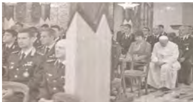
O.R. 24-03-2013: Igualitarismo y rechazo del espíritu de jerarquía.

El Papa Benedicto XVI insinúa dudas sobre la