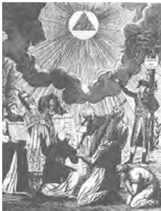
El ideal masónico de la igualdad de las religiones.

"El poder y el dominio del rey deben ser atribuidos, en el sentido propio de la palabra, a Cristo en su Humanidad... y por tanto, la soberanía suprema y absoluta sobre todas las creaturas [el Estado es una creatura, n.d.a]. Cristo tiene poder sobre todas las creaturas. Por lo tanto, es UN DOGMA DE FE CATOLICA que Cristo Jesús ha sido enviado a los hombres tanto como Redentor, por quien deben salvarse, como Legislador, hallándose en la obligación de obedecer... [Tiene] por tanto, un poder legislativo, un poder judicial... y un poder ejecutivo... Además, es un grosero error rechazarle a Cristo-Hombre su soberanía sobre las cosas temporales , sean las que fueren: El tiene concedido por su Padre un derecho absoluto sobre todas las creaturas, permitiéndole actuar a su plena voluntad sobre todas ellas... Su imperio no se limita exclusivamente a las naciones católicas ni sólo a los cristianos bautizados... sino que abarca, sin excepción, a todos los hombres, incluso a los extraños a la fe cristiana , de tal modo que el imperio de Jesucristo es, en estricta verdad, sobre la universalidad del género humano y, desde este punto de vista, no hay que hacer ninguna distin-