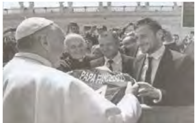
O.R., 27-04-2013: El Papa hace publicar en el Osservatore Romano muchas fotos en donde recibe camisetas de fútbol.

D-2012 12. Si el exégeta quiere dedicarse con provecho a los estudios bíblicos debe ante todo dar la mano a toda opinión preconcebida