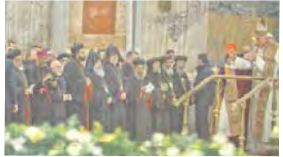
O.R., 27-01-2013 : El Papa Benedicto XVI «Concluye la Semana de oración por la unidad de los cristianos».