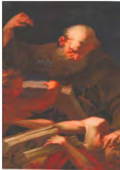
En contra de la herejía protestante: la Contra-Reforma en el arte. Ligari, pintor de la Valtellina, Sondrio, Museo Sassi.

Nicola Gori entrevista al arzobispo Baldisseri, O.R., 12-10-2013: «El Sínodo... es un instituto eclesiástico central por su naturaleza perpetua... el Sínodo es el fruto de la