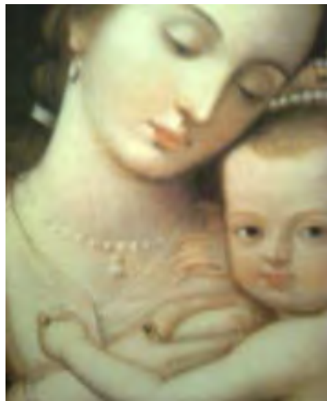
Pintura del Perú.