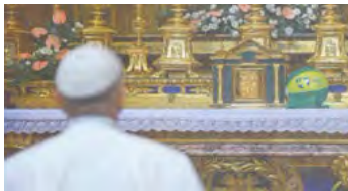
O.R., 29-07-2013: El Papa pone la pelota de fútbol en el altar al lado del Sagrario.

El Papa Benedicto XVI O.R., 18-01-2010: «Mi peregrinación... en la Sinagoga a Colonia y Nueva York. Además, a la Iglesia no le ha faltado el hecho de arrepentirse por la falta de sus hijos y sus hijas pidiendo perdón por todo».