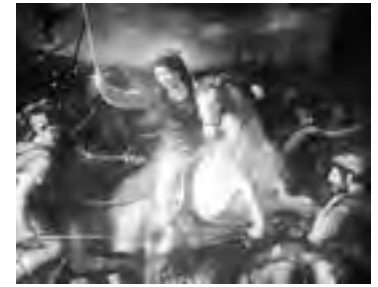
La Virgen de Scicli (Sicilia). El Papa Clemente XII reconoció con el Decreto del 10 de marzo de 1736 la milagrosa aparición de la virgen en la cual Ella combatió con una espada en contra de los islámicos, matando Ella sola más de lo que hubiera hecho un ejército entero.

Esquema de la descristianización de la sociedad temporal, Pío XII, 12.10.1952: «En el curso de estos últimos siglos se ha intentado la disgregación intelectual, moral y social de la unidad en el organismo misterioso de Cristo. Quisieron la naturaleza sin la gracia, la razón sin la fe, la libertad sin la autoridad, y alguna vez también la autoridad sin la libertad. Este «enemigo» se ha hecho cada vez más concreto, con una audacia que Nos deja sorprendidos: Cristo sí, la Iglesia no. Después: Dios sí, Cristo no. Y en fin el grito impío: Dios ha muerto; o más bien Dios nunca ha existido. He aquí la tentación de edificar la estructura del mundo [mundialismo] sobre unos cimientos que Nosotros sin ninguna incitación señalamos con el dedo como los principales responsables de la amenaza que pesa sobre la humanidad: una economía sin Dios, un derecho sin Dios, una política sin Dios [laicismo liberal]».