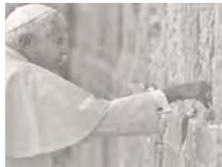
Benedicto, XVI O.R., 16-02-2013

El Papa Francisco, 20-06-2013: « Las divisiones entre nosotros, pero también las divisiones entre las comunidades: cristianos evangélicos, cristianos ortodoxos, cristianos católicos, ¿pero por qué divididos? Tenemos que buscar llevar a la unidad ».