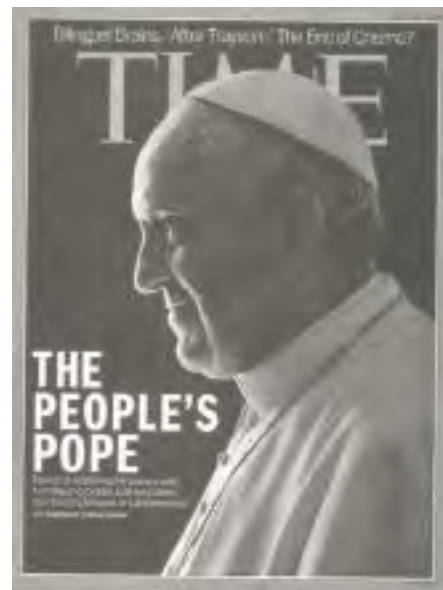
O.R., 22-07-2013: "Portada del Time.

época debe estar caracterizada por las activas.