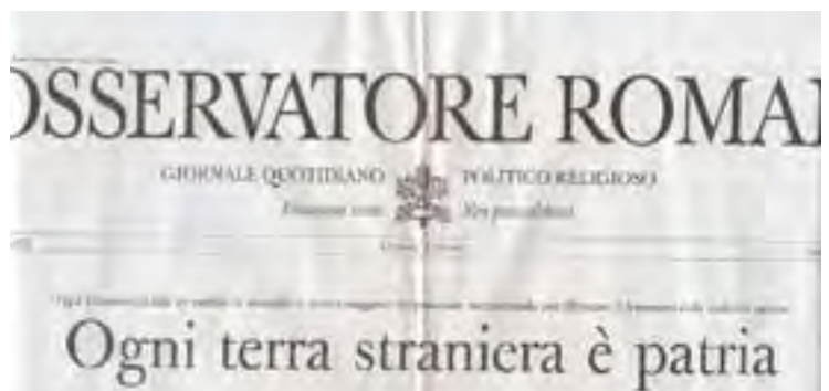
O.R., 25-09-2013: «Toda tierra extranjera es mi patria».

León XIII, 05-09-1895: «En fin los príncipes y los Pontífices romanos, custodios y defensores de la fe, los unos en la dirección de sus guerras santas, los otros en la promul-