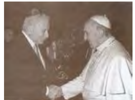
El Papa Francisco con el presidente de la “Unione delle Comunità Ebraiche italiane” O.R., 13-10-2013

El Papa Francisco se hace bendecir por el Patriarca ortodoxo, cismático y herético O.R., 10-05-2013: «Santidad... hace 40 años, la Declaración común de nuestros