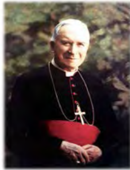
S. E. Monseñor Marcel Lefebvre.

Monseñor G.L. Müller en contra de la comunión de los que se han vuelto a casar, O.R., 23-10-2013: « Los divorciados y vueltos a casar... no se les puede conceder todavía la admisión a la eucaristía... una reconciliación mediante el sacramento de la penitencia, que abriría el camino al sacramento eucarístico, se le puede acordar sólo sobre la base del arrepentimiento respecto a lo que ha pasado, y sobre la disponibilidad a una forma de vida ya no más en contradicción con la indisolubilidad del matrimonio ».