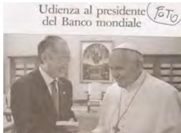
O.R., 28-10-2013. El Papa con el presidente del Banco mundial. El Papa Francisco, O.R., 26-07-2013: «Quiero ... que nos defendamos de todo lo que es mundanalidad».