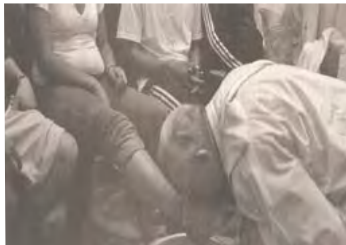
O.R., 23-03-2013: "El Card. Bergoglio en el Jueves Santo 2012".