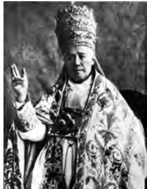
San Pío X: la tiara es símbolo de Magisterio sacralidad y jerarquía.

Asunción, etcétera, vean los textos en esta “Documentación sobre la Revolución en la Iglesia”. Entonces esta teoría “de una manera nueva” supone una enseñanza diferente del Magisterio