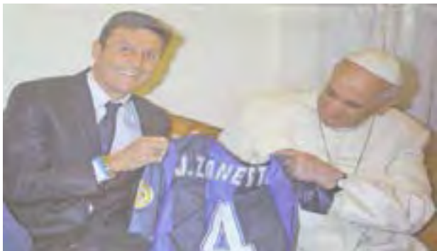
O.R., 27-04-2013, Decenas de veces el Papa se hace fotografiar con las camisetas de fútbol.

Osservatore Romano, 12-08-2013: «En Polonia es un acto de ley contra la shechitah, es decir la carnicería ritual judía... se espera un posible intervención de los rabinos italianos en el Vaticano».