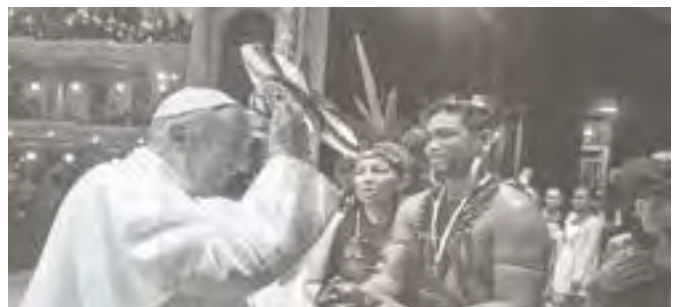
El Papa se pone las plumas de indio.