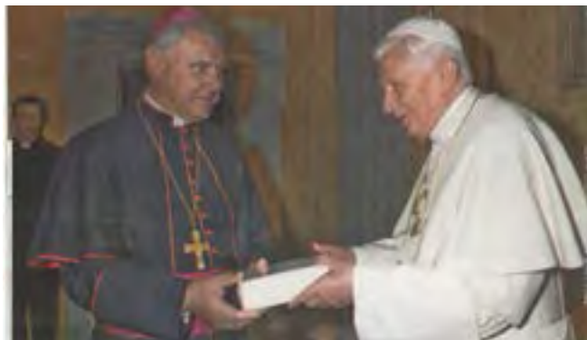
Osservatore Romano, 03-12-2012: «Las “Obras Completas de Josef Ratzinger”...»

Quiero seguir en la reflexión sobre como ejercer el Primado Petriano que se empezó en el 2007 por la Comisión Mixta que ha llevado a la firma del Documento de Ravenna. Se debe seguir en este camino... Tenemos que caminar unidos en las diferencias: no existe otro camino para unirnos. Este es el camino de Jesús».