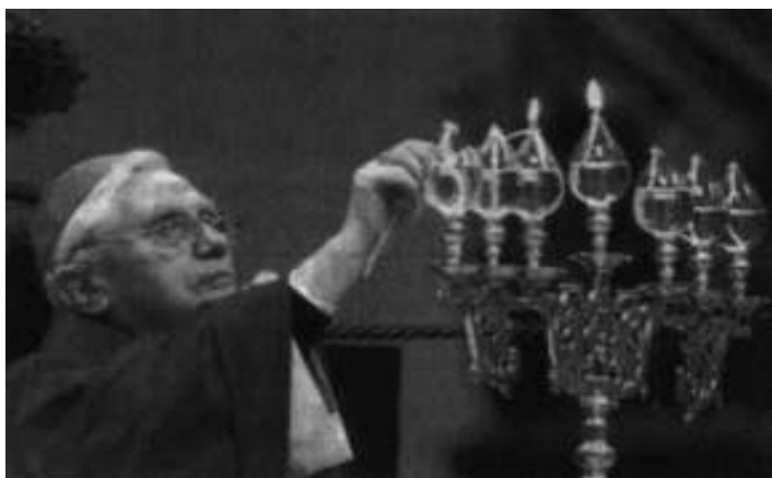
El Cardenal Ratzinger durante la ceremonia del arrepentimiento

He aquí lo que alcanzó con su método en poco menos de un año: