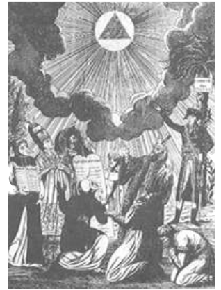
El ideal masónico de la igualdad de las religiones

"...Nos debemos nuevamente recordar y reprobar el gravísimo error en que se encuentran, desgraciadamente, algunos católicos, que sostienen la creencia de que las personas viviendo en el error, y fuera de la verdadera fe y la unidad católica pueden alcanzar la vida eterna. Esto es contrario a la doctrina católica."