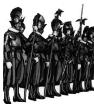
Revolución en la Iglesia si, pero unitaria y controlada.

Para comprender esta situación es necesario saber que los enemigos de la Iglesia, después de haber introducido los principios