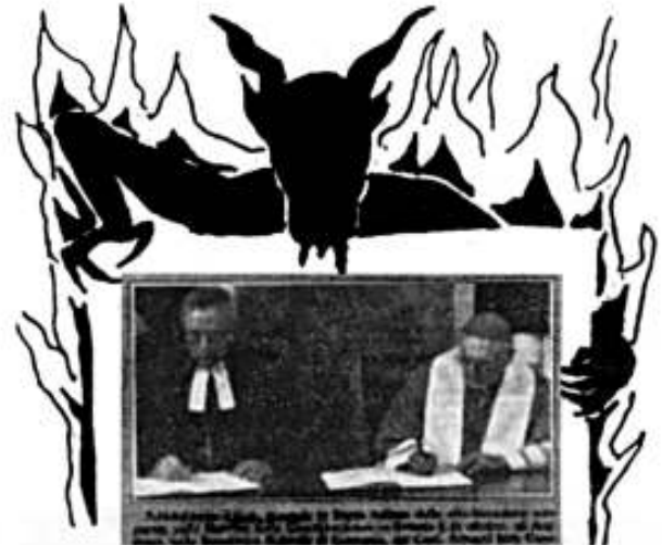
Foto histórica de las 44 afirmaciones comunes con los luteranos sobre la justificación del 31 de octubre de 1999.

Tenemos otros informes... sobre los engaños con los cuales ponen en peligro la vida de los Cristianos”.