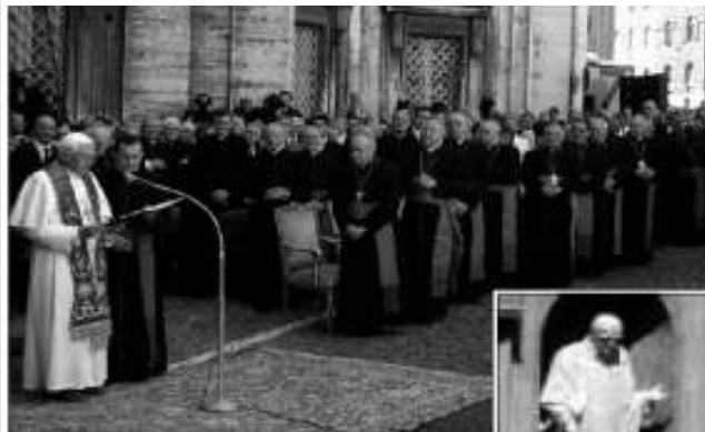
Il Papa benedice la statua di s. Josemaria Escrivá de Balaguer