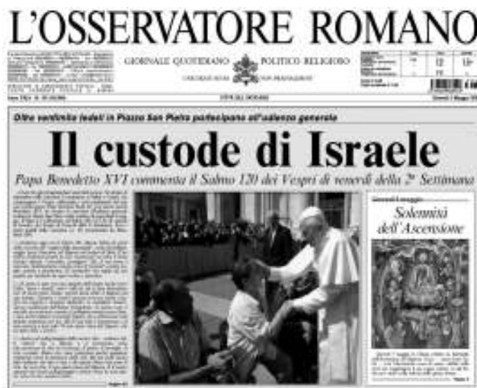
“El custodio de Israel”, O.R. 05.05.2005.

Pío XII, 21.3.1957: «... toda la Iglesia de Cristo es un cuerpo vivo... pero aquí en Roma, es decir en el corazón de este gran organismo... esta catolicidad... une a todos en un abrazo común de fraternidad inefable...«Ustedes, desde Roma, con su sacerdocio romano, pueden llevarse un grado mayor de generosa catolicidad... En donde hoy muchos ven el porvenir y la salvación del mundo. En fin, parece claro que la romanidad debería significar también el sentimiento profundo y arraigado, de que en Roma está el centro de la Iglesia...» .