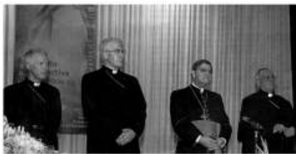
O.R. 26.06.2005, Fátima: los obispos esconden su cruz.

comunidades , semejantes en algún aspecto, pero distintas y no unidas entre ellas por aquellas ataduras que forman una sola e indivisible Iglesia, de tal manera que, recitando los símbolos de la fe, nosotros decimos: “Yo creo en la única Iglesia”».