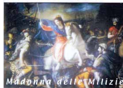
La Virgen de Scicli (Sicilia). El Papa Clemente XII reconoció con el Decreto del 10 de marzo de 1736 la milagrosa aparición de la Virgen en la cual Ella combatió con una espada en contra de los islámicos, matando a Ella sola más de lo que hubiera hecho un ejército entero

Esquema de la descristianización de la sociedad temporal, Pío XII, 12.10.1952: «En el curso de estos últimos siglos se ha intentado la disgregación intelectual, moral y social de la unidad en el organismo misterioso de Cristo. Quisieron la naturaleza sin la gracia, la razón sin la fe, la libertad sin la autoridad, y alguna vez también la autoridad sin la libertad. Este «enemigo» se ha hecho cada vez más concreto, con una audacia que Nos deja sorprendidos: Cristo sí, la Iglesia no. Después: Dios sí, Cristo no. Y en fin el grito impío: Dios ha muerto; o más bien Dios nunca ha existido. He aquí la tentación de edificar la estructura del mundo [mundialismo] sobre unos cimientos que Nosotros, sin dudar, señalamos con el dedo como los principales responsables de la amenaza que pesa sobre la humanidad: una economía sin Dios, un derecho sin Dios, una política sin Dios [laicismo liberal]. »