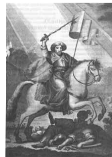
La histórica aparición de San Santiago Apóstol en la batalla de Clavijo, para ayudar a los cristianos en contra del Islam. ¿Qué piensa el Cielo del ecumenismo?