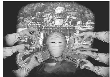
El Concilio Vaticano II: libertad de conciencia, democracia en la Iglesia, ecumenismo, revolución antimariana, judaización, revolución antifilosófica, pacifismo, etc... Han deformado el rostro de la Santa Iglesia Romana

b) En el caso de una aparente ruptura, como hizo Benedicto XVI que hizo una restauración pero manteniendo los principios de libertad, igualdad y fraternidad, entonces se manifestarán situaciones de persecución severa o