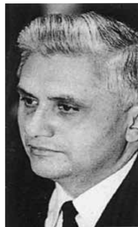
Ratzinger al Concilio

Recordemos: La historia es la lucha entre Dios y Satanás, entre el bien y el mal. La historia es maestra de vida. Lo que pasa en la Iglesia Católica es la Revolución con sus doctrinas y métodos.