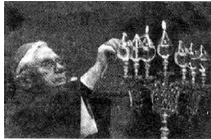
Card. Ratzinger, con el candelabro judío durante la ceremonia del Arrepentimiento

ninguna restauración es posible... pero si por "restauración" entendemos la búsqueda de un nuevo equilibrio... entonces sí... ya se esta haciendo. Cardenal Ratzinger, Jesús, nov. 1984: «Sí, el problema de los años sesenta era adquirir los mejores valores expresados por dos siglos de cultura liberal.» [libertad, igualdad, fraternidad, ]