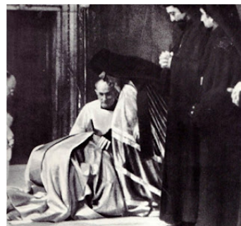
Osservatore Romano 01.03.2021: "Il famoso umile [sic] gesto del bacio ai piedi del metropolita Melitone [scismatico] da parte del Pontefice Paolo VI il 14 dicembre 1974." La cosa viene da lontano

134. "Il papa eserciterebbe il primato come primo tra i patriarchi... 141. "Limitazione volontaria nell'esercizio del potere... Questo vale anche per l'ufficio papale... 145. "Una rinnovata interpretazione del Vaticano I... 147.