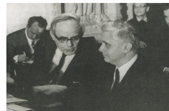
Ratzinger con l'eretico Karl Rahner al Concilio. "Il simile va con il simile"

Osservatore Romano 24.02.2011: «Con Benedetto XVI la Tiara è scomparsa dallo stemma ufficiale del Pontefice.»