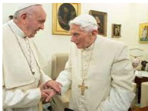
"n°135 nota 25: Una prospettiva simile è stata formulata da Joseph Ratzinger".

Leone XIII, edizione originale dell'esorcismo: "Li dov'è la sede di Pietro hanno posto il trono delle loro abominazioni".