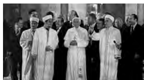
Benedetto XVI, scalzo, nella Moschea OR.07.12.2006

6) La Rivoluzione della dottrina sociale: B.XVI OR: 23.12. 2006: «Accogliere le vere conquiste dell'illuminismo» B.XVI OR, 6.10.2007 «La Commissione teologica internazionale... adesso... la legge morale naturale... la fede non è un'imposizione dall'esterno». B.XVI OR,14.5.2007: «Il rispetto di una sana laicità compresa la pluralità delle posizioni politiche è essenziale alla tradizione cattolica». B.XVI OR,08.01.2007: «costruzione di un umanesimo integrale». B.XVI, O.R. 7.6.2008 ripete ancora: «Dobbiamo accogliere le autentiche conquiste dell'illuminismo». B.XVI O.R. 01/05/2008: «All'udienza generale il Papa ripropone gli Stati Uniti come valido esempio di laicità. Nella patria della libertà religiosa...» nel contesto liturgico dei Vespri abbiamo lodato il Signore per il cammino compiuto dal popolo di Dio negli Stati Uniti... Nella ricorrenza del 60° anniversario della «Dichiarazione Universale dei Diritti dell'Uomo», la Provvidenza mi ha dato l'opportunità di confermare il valore di