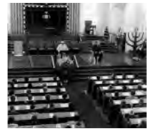
Benedetto XVI nella Sinagoga a Colonia OR.2108.2005

obbiettivo grande». B.XVI O. R. 13/05/09: «... I nostri passi verso o dalla sinagoga, la Chiesa, la moschea, o il tempio percorrono il sentiero della nostra singola storia umana, spianando la strada, potremmo dire, verso l'eterna Gerusalemme». B. XVI, O.R. 10/04/09: «Bultmann ha ragione... in ultima analisi non veniamo consacrati mediante riti» INVECE PIO XI MORTALIAM ANIMOS : «QUESTI PAN-CRISTIANI... CHE CERCANO DI FEDERARE LE CHIESE ... PER QUELLA STRADA SI TERMINERÀ ... ALL'INDIFFERENTISMO E A CIÒ CHE SI CHIAMA IL MODERNISMO... INVITANO TUTTI GLI UOMINI INDISTINTAMENTE, GLI INFEDELI DI OGNI TIPO ...TALI IMPRESE NON POSSONO ESSERE IN NESSUNA MANIERA APPROVATE DAI CATTOLICI PERCHÉ SI APPOGGIANO SULLA TEORIA ERRATA CHE LE RELIGIONI SONO TUTTE PIÙ O MENO BUONE E LODABILI».