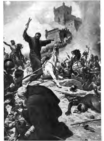
San Lorenzo da Brindisi alla Crociata di Alba Reale contro i musulmani