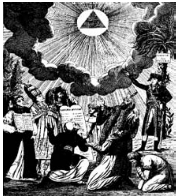
L'ideale massonico dell'uguaglianza delle religioni

18. Giovanni rivendica a sé il ruolo di testimone di Cristo; in verità egli non è che un eccellente testimone di vita cristiana, ovvero della vita di Cristo alla fine del primo secolo. —