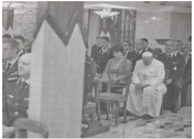
Il papa Francesco seduto uguale agli altri O.R. 06.04.2013

[ dopo il Vaticano II ] questi diritti per tutte le religioni nel mondo intero».