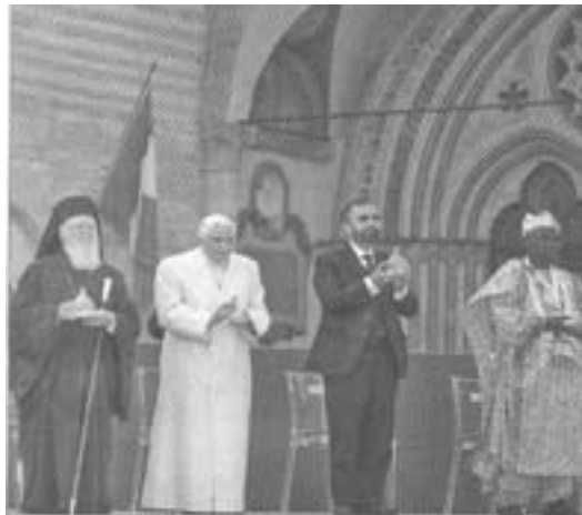
Foto delle "americanate" di Assisi: l'Osservatore Romano del 28.10.2013 fa la propaganda alle eresie ecumeniche di Benedetto XVI