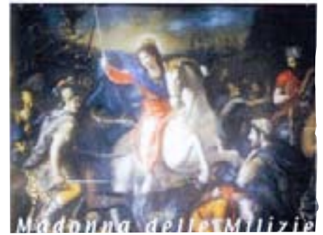
La Vergine di Scicli (Sicilia). Il Papa Clemente XII riconobbe con il Decreto del 10 marzo 1736 la miracolosa apparizione della Vergine nella quale Lei combatte' con una spada, contro gli islamici, uccidendone. Lei sola, piu' di quanto avrebbe potuto fare un intero esercito.