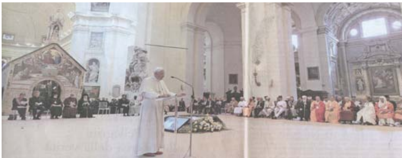
Foto delle "americanate" di Assisi: l'Osservatore Romano del 28.10.2013 fa la propaganda alle eresie ecumeniche di Benedetto XVI

Il Papa Benedetto XVI alla delegazione del Patriarcato di Costantinopoli O. R. 29.06.2011: « Sua santità Bartolomeo si prodiga su questi temi. In unione di intenti, e ricordando il bell'esempio del mio predecessore, il Beato Giovanni Paolo II, ho voluto invitare i fratelli cristiani, gli esponenti delle altre tradizioni religiose del mondo e personalità del mondo della cultura e della scienza, a partecipare il prossimo 27 ottobre nella città di Assisi ad una "Giornata di riflessione, dialogo e preghiera per la pace e la giustizia nel mondo" ... sarà il segno della volontà di continuare la via del dialogo e della fraternità».