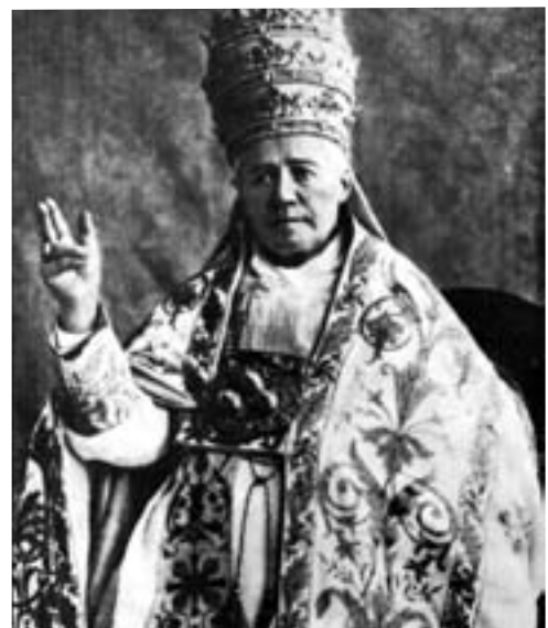
San Pio X: sacralità e gerarchia ...O l’uomo della contemplazione modifica il mondo alla luce della Verità eterna... ...o il mondo paganizza, laicizza l’uomo religioso.

Cardinal Tauran O. R. 27.10.2011: « I fanatismi rischiano sfigurare le religioni ... siccome nella storia le religioni non hanno sempre favorito la concordia e la pace, è più che mai necessario, in tempi di globalizzazione, dimostrare che tutte le religioni, in realtà, sono chiamate ad essere messaggere di fraternità. Passando a considerazioni più elaborate ... essendo la ragione lo specifico dell’uomo, la ricerca della verità accomuna credenti e uomini di buona volontà per noi cattolici esiste una fraternità fondamentale tra tutti i membri della famiglia umana ... Cristo è anche presente e attivo in maniera misteriosa nelle realtà umane e nelle tradizioni religiose dell’umanità ... Benedetto XVI ha anche invitato ... uomini e donne in cerca di Dio ... che sono ancora nel “cortile dei gentili” ». Card. Ravasi, O.R. 12.10.2011: “ Il Cortile dei Gentili, voluto da Benedetto XVI ”.