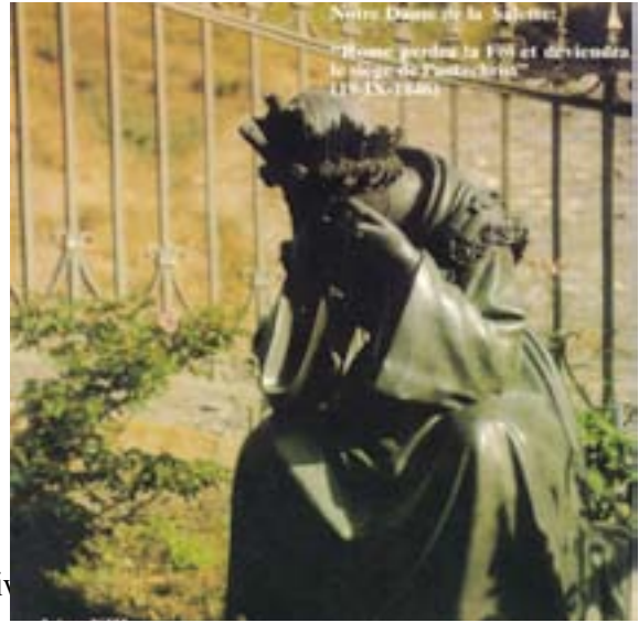
Apparizione di Nostra Signora di La Salette, 19.09.1846: « Roma perderà la fede e diventerà la sede dell'Anticristo »

Osservatore Romano riconosce anche agli ortodossi la tesi di Ratzinger che la Chiesa si fonda nell'Eucarestia e non nel Magistero O. R. 09.09.2011: « Il principio sul quale si fonda l'ecclesiologia ortodossa è quindi quello del “ Chiesa eucaristicamente e localmente definita”. »