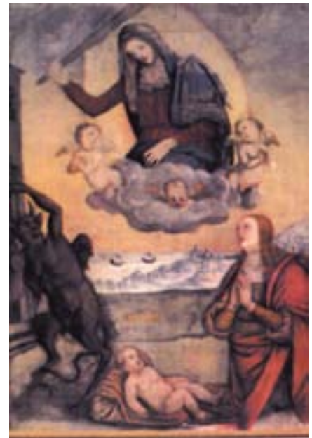
Madonna del bastone contro i demoni, S. Maria del Soccorso, (Castellammare del Golfo). Il 16 di settembre 1798 fu coronata dal Capitolo Vaticano