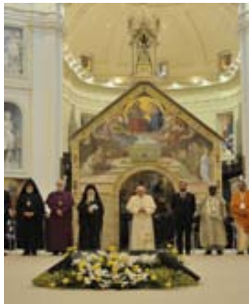
Il papa Benedetto XVI, a Assisi O.R. 28.10.2011