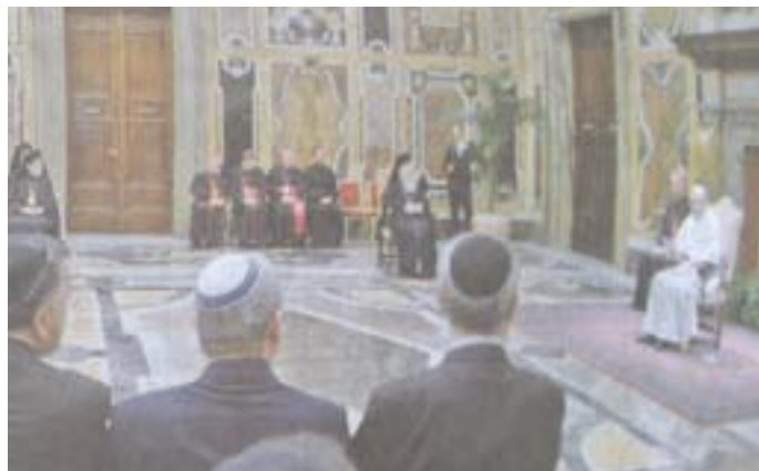
Il papa Francesco con gli ebrei e gli ortodossi O.R 21.03.2013

Gerusalemme, la “ Città della Pace”, patria spirituale di Ebrei, Cristiani e Mussulmani».