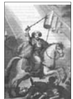
La storica apparizione di S. Giacomo apostolo alla battaglia di Clavijo, per aiutare i cristiani contro l'Islam. Cosa pensa il Cielo dell'ecumenismo?

V° Rivoluzione = - realismo = alienazione «Civiltà artificiale» (Pio XII, 15.11.1946), distruzione anche dell'ordine naturale. Es. Rivoluzione industriale, Rivoluzione culturale omosessuale, ecc... «La grazia suppone, perfeziona la natura, non la toglie.»