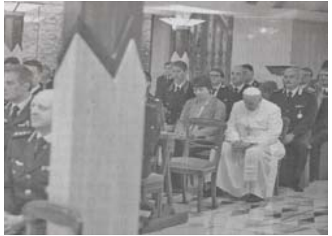
Il papa Francesco seduto uguale agli altri O.R. 06.04.2013

[ dopo il Vaticano II ] questi diritti per tutte le religioni nel mondo intero».