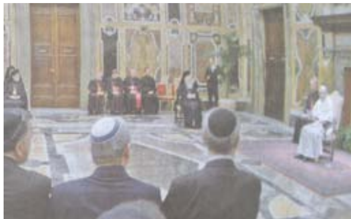
Il papa Francesco con gli ebrei e gli ortodossi O.R 21.03.2013

Gerusalemme, la “ Città della Pace”, patria spirituale di Ebrei, Cristiani e Mussulmani».