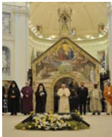
Il papa Benedetto XVI, a Assisi O.R. 28.10.2011