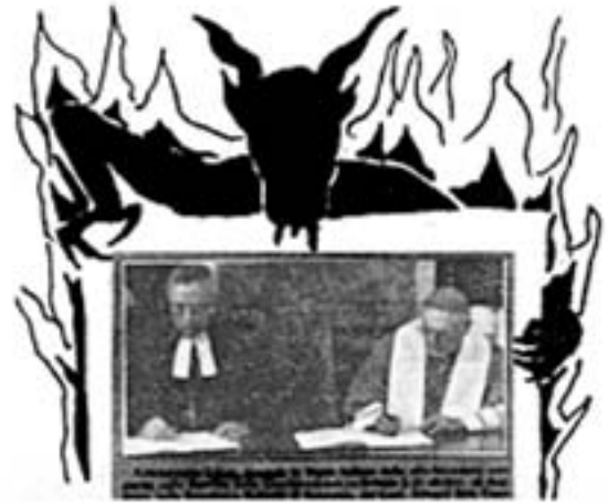
Con questa firma del 31.10.1999 i papi accettano la dottrina sulla Giustificazione protestante. Foto storica delle 44 proposizioni comuni sulla Giustificazione, O.R. 12.11.1999

Ecumenismo § 4 per i 25 anni del congresso di Assisi lasciamo al lettore di leggere tutti i discorsi pubblicati dall'Osservatore Romano dai rappresentanti delle varie religioni dal panteismo indù al buddismo, ai saggi del talmud ebraico ecc...