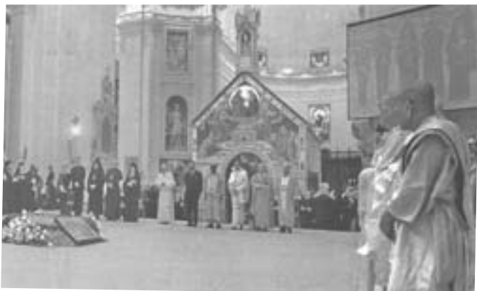
Foto delle “americanate” di Assisi: OR 28.10.2013 fa propaganda alle eresie ecumeniche di Benedetto XVI