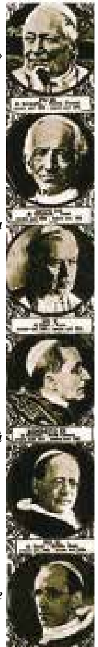
I papi del Vaticano II insegnano il contrario dei Papi di prima.

Come disubbidire alla dottrina che tutti i Papi, sempre e ovunque hanno insegnato?