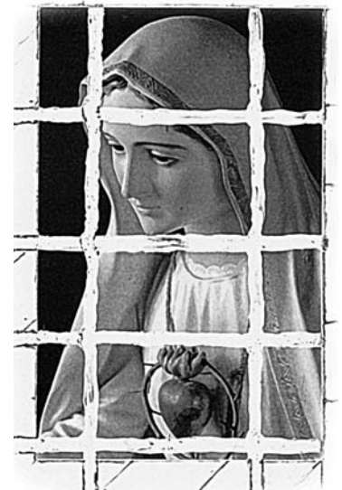
Benoît XVI a confirmé à nouveau la fausse interprétation du 3 ème secret de Fatima

Mgr Ravasi : « La véritable alternative n’est pas entre évolution et création » (O.R. 16.11.2007).