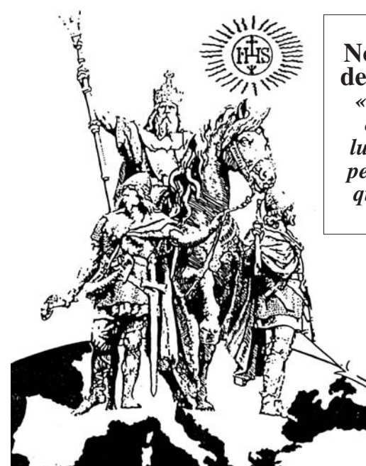
Charlemagne commence à unifier l'Europe dans la Foi Catholique Romaine

Donné à Rome, près Saint-Pierre, le 11 décembre de l'Année sainte 1925, la quatrième de notre Pontificat. Pie XI, Pape. »