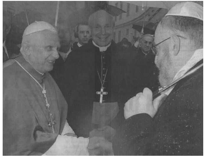
Le Pape avec le Rabbin de Vienne, O.R. 13.9.2007

...C'est vraiment très important... le livre sur "Raïssa Maritain, une juive chrétienne, entre mystique et poésie"... dans son influence sur son mari.»