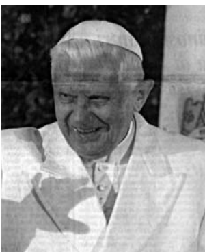
Le Pape Benoît XVI, O.R. 8.9.2007