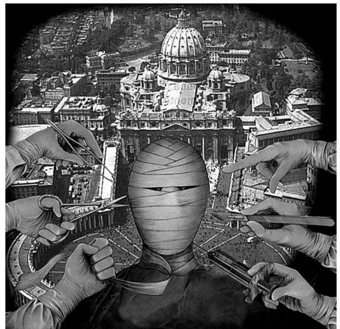
OPÉRATION CHIRURGICALE SUR LA FOI: la Révolution antimariale, Révolution anti-ecclesiale, Doctrine de la Justification, la judaïsation de l'Église, l'œcuménisme, la Révolution anti-papale, la Révolution anti-philosophique, la Pseudo-Restauration, la liberté de conscience, pacifisme, le libéralisme dans l'Église

Saint Pie X, Vehementer 11.2.1906 : «...Qu'il faille séparer l'État de l'Église, c'est une thèse absolument fautive, une très pernicieuse erreur.