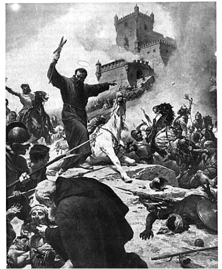
St Laurent de Brindis pendant la croisade contre les musulmans, à Alba Reale