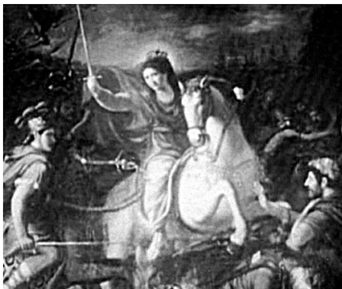
Apparition de la Vierge à Scicli (Sicile), année 1091. Le Pape Clément XII a reconnu, par le Décret du 10 mars 1736, la miraculeuse apparition dans laquelle la Vierge combattit les musulmans armée d'une épée, tuant à Elle seule de son bras puissant, plus que ce qu'aurait pu espérer une armée entière .

La véritable Église du Christ est constituée par l'autorité divine et reconnue par quatre notes, auxquelles, dans le Symbole, nous affirmons qu'il faut croire. Chacune de ces notes est si intimement unie aux autres qu'elle ne peut en être séparée. D'où il résulte que l'Église qui est vraiment catholique et dite telle doit en même temps manifester les prérogatives de l'unité, de la sainteté, de la succession apostolique. L'Église catholique est donc une, d'une unité remarquable et parfaite sur toute la terre et parmi toutes les nations... Il n'est pas d'autre Église catholique que celle qui, bâtie sur Pierre seul, est "un corps joint et assemblé" (Ep 4, 16).»