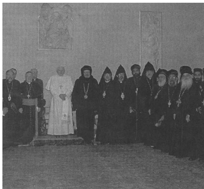
le Pape avec la Commission pour le dialogue avec les Églises orthodoxes, O.R. 2.2.2007

Plus d'une raison du reste nous fait employer ce mot, car,