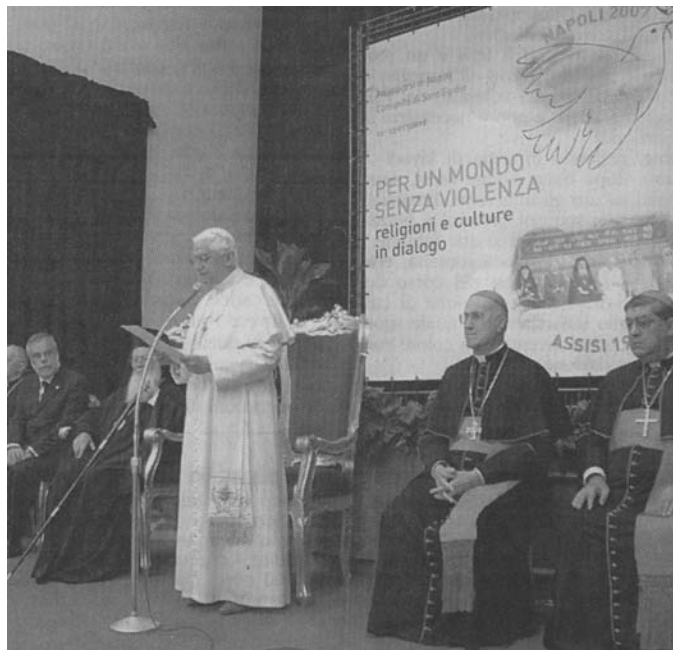
Le Pape à l'occasion de l'anniversaire du Congrès d'Assise, O.R. 22.10.2007

Doctrine de la Justification définie par le Concile de