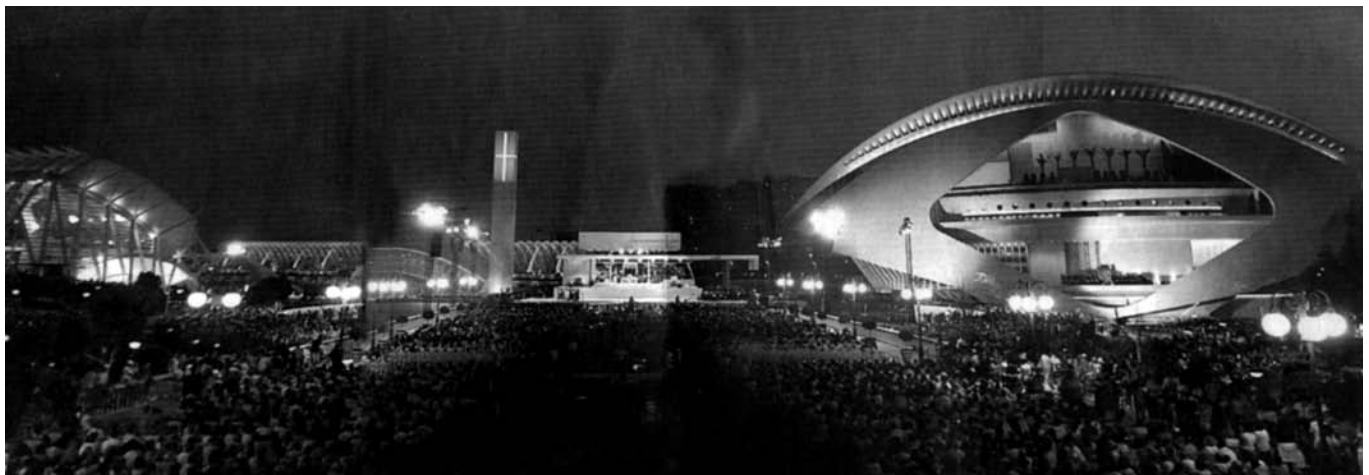
Le cadre liturgique de la cérémonie conduite par le Pape à Valence, O.R. 10.7.06

En ce jour de joie et d'exultation, Dieu sait combien Nous voudrions pouvoir oublier l'âpreté des temps que nous traver-