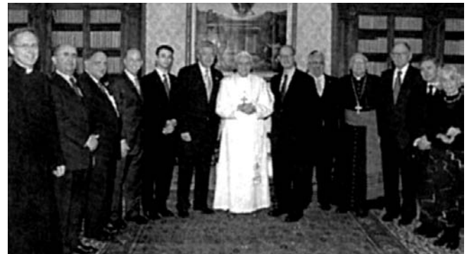
Le Pape reçoit la Délégation du "B'nai B'rith International" (O.R. 18.12.06)

Canon 32. Si quelqu'un dit que les bonnes œuvres de l'homme justifié sont les dons de Dieu en ce sens qu'ils ne soient pas aussi les bons mérites du justifié; ou que, par ces bonnes œuvres qu'il accomplit, par la grâce de Dieu et le mérite du Christ (dont il est un membre vivant), le justifié ne mérite vraiment ni un accroissement de grâce ni la vie éternelle ni (s'il meurt dans la grâce) l'entrée dans cette vie éternelle, ainsi qu'un accroissement de gloire, qu'il soit anathème. (Dz 1582)