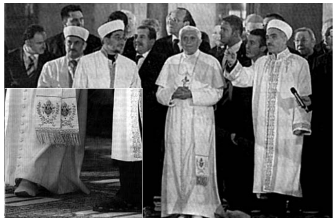
Le Pape Benoît XVI se déchausse dans la Mosquée Bleue «et se recueille quelques instant en ce lieu de prière», (O.R. 7.12.2006)

Pie XI, 25.12.1931 : « Dans la solennité où la Sainte Vierge Marie nous donna le Sauveur... Nous espérons pour nos frères et nos fils très aimés, qui vivent séparés du Siège Apostolique... que naisse au moins en eux le désir du seul berceuil de l'unique Pasteur et du retour à la foi véritable que l'Église romaine garde jalousement en toute sûreté et intégrité. »