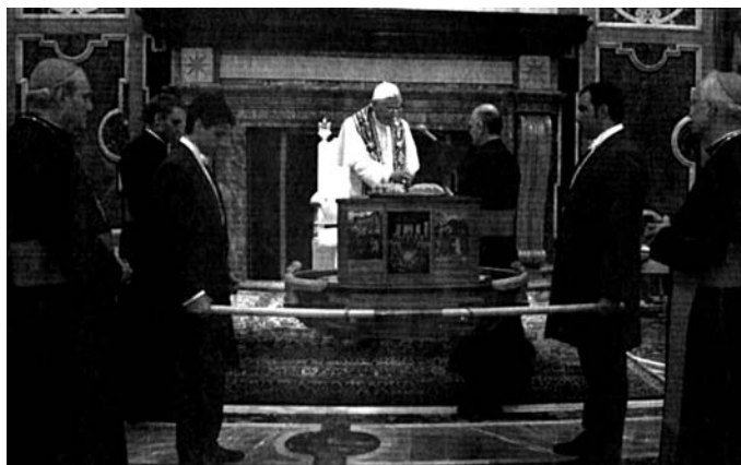
(O.R. 12.5.06) : «Le Pape bénit l'Arche de la Nouvelle Alliance»