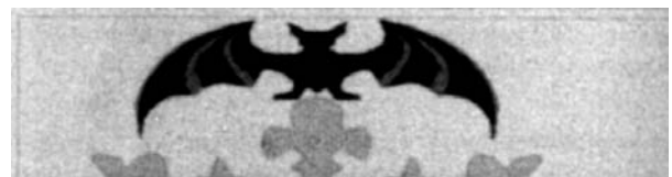
Détail des Armoiries officielles de Valence: une chauve-souris

Le Pape bénit l'entrée de la station de métro de Valence (Espagne) Dans la station de métro de Valence (il faut noter qu'elle s'appelait, déjà avant, Jésus)(O.R. 9.7.2006). Trois jours avant sa venue, un accident avait causé 42 morts, le plus grand désastre du métro espagnol (O.R. 5.7.06)