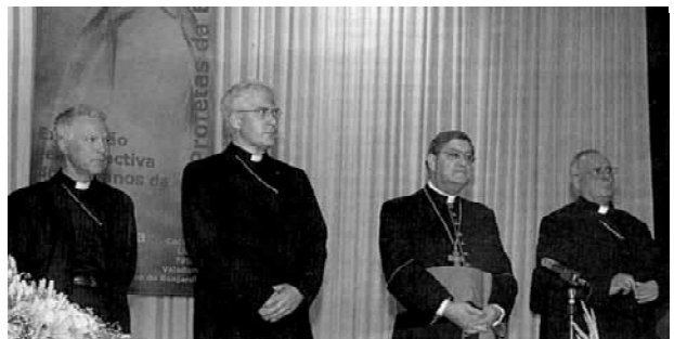
O.R. 26.6.2005, Fatima. Les évêques cachent leur croix

Pie IX, 6.3.1873 : «...[les] catholiques libéraux... poussant l'esprit à la tolérance... sont plus dangereux et font plus