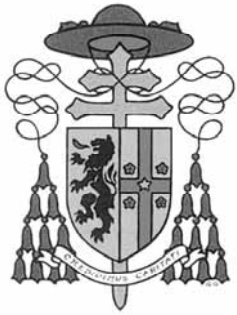
Armoiries de S.E. Mgr Marcel Lefebvre