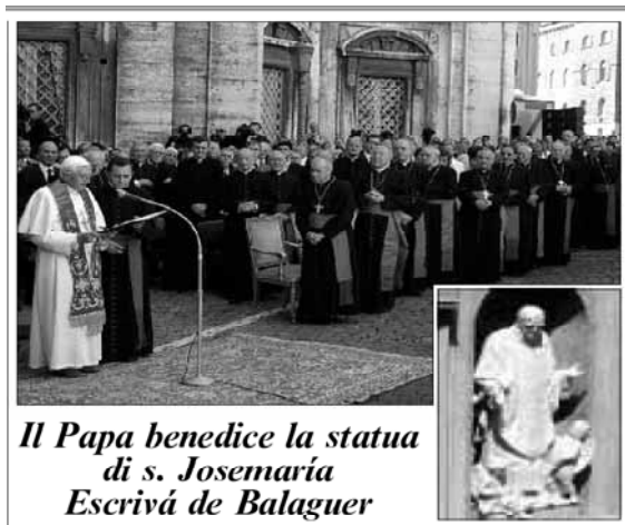
Il Papa benedice la statua di s. Josemaría Escrivá de Balaguer

Pie XII, 1.6.1941 : « ...de la forme donnée à la société, conforme ou non aux lois divines, dépend et grandit aussi le bien ou le mal des âmes... »