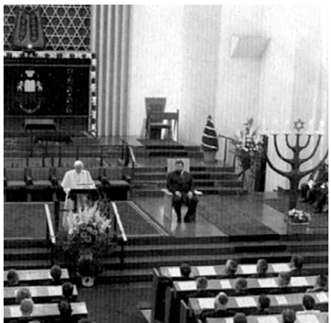
Le Pape Benoît XVI, lors de son premier voyage apostolique, visite la Synagogue de Cologne, O.R. 21.8.2005

Or il n'y a pas deux consciences dans l'homme, non plus