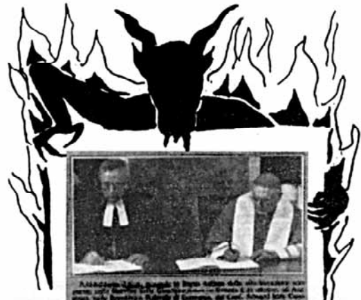
Photo historique de la signature des 44 affirmations communes avec les luthériens, 31 oct. 1999

Saint Pie V "Hebraeorum gens" : «Le peuple juif, le seul autrefois élu par Dieu... autant il avait dépassé tous les autres en grâce et sainteté, autant il a été abandonné à cause de son incrédulité et mérita d'être reprouvé parce que, étant venue la plénitude des temps, ce même peuple perfide et ingrat, a repoussé avec impiété son Rédempteur, le condamnant à une mort honteuse... Toutefois leur impiété, mise en œuvre par les pires astuces, est arrivée à un point tel que désormais, pour notre commun salut, il est nécessaire de repousser la force de tant de maux par un prompt remède... Ce qui cause le plus de dommage c'est le fait que, étant adonnés aux sortilèges, aux incantations, aux superstitions de la magie et aux maléfices, ils induisent aux tromperies de Satan un grand nombre de per-