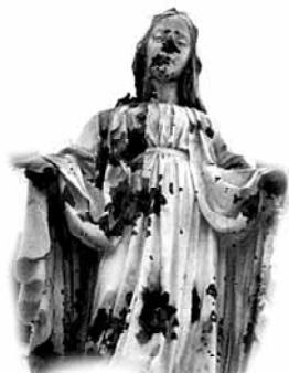
Statue de la Vierge de Bethléhem balafrée par les armes des soldats Israéliens