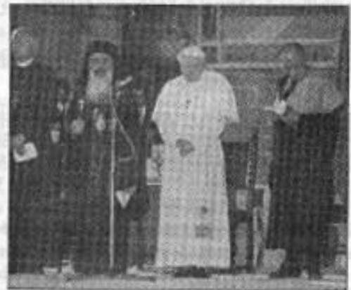
Le Pape à Assise

Rome, du siège de la Congrégation pour la Doctrine de la Foi, le 28 mai 1992. Card. Joseph Ratzinger , préfet