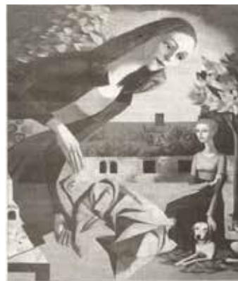
O.R. 25.03.2019 : Image blasphématoire de l'Annonciation

Le Card. Ratzinger enseigne que : « les dogmes mariaux ne peuvent absolument pas être déduits du Nouveau Testament. » (O.R., 13.05.1995)