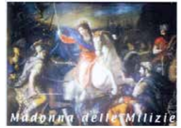
Apparition de la Vierge à Scicli (Sicile), année 1091. Le Pape Clément XII a reconnu, par le Décret du 10 mars 1736, la miraculeuse apparition dans laquelle la Vierge combattit les musulmans armée d'une épée, tuant à Elle seule de son bras puissant, plus que ce qu'aurait pu espérer une armée entière.