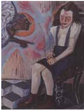
L'Annunciazione, supplemento Osservatore Romano, "Donne, Chiesa, mondo", maggio 2017

l'interview à "Jésus" il est plus explicite : « Oui, le problème des années soixante était d'acquérir les meilleures valeurs exprimées par deux siècles de culture libérale. »