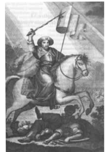
L'apparition historique de Saint Jacques Apôtres, dans la bataille de Clavijo, pour aider les Chrétiens contre l'Islam. Que pense le Ciel de l'occuménisme ?

«La civilisation artificielle» (Pie XII, 15.11.1946). Destruction aussi de l'ordre naturel qui est nécessaire à la grâce. ex. la Révolution culturelle homosexuelle, etc. «La grâce perfectionne la nature, elle ne le remplace pas».